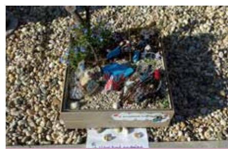
Kiserdei Óvoda kiscsoport