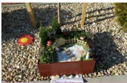
Kiserdei Óvoda nagy csoport